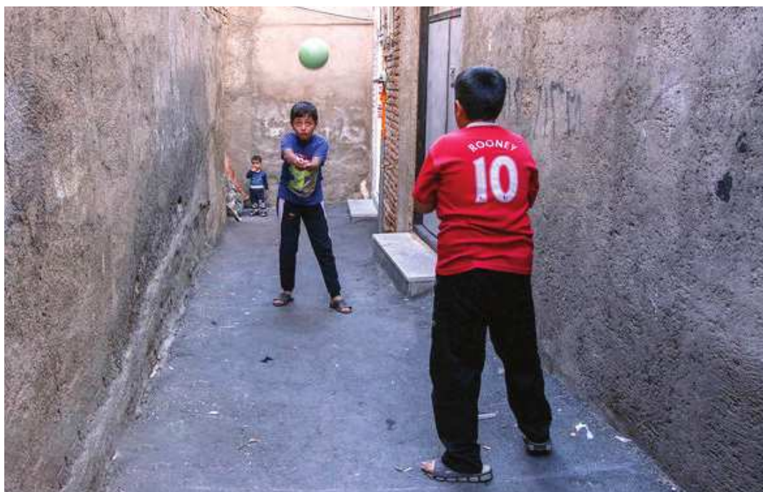
منابع مورد استفاده

اردکانیان، عباس (۱۳۸۹). اهمیت آموزش اوقات فراغت در ارتقای سلامت جامعه. برگ فرهنگ. شیخی، محمد تقی (۱۳۸۹). بررسی جامعه‌شناختی کیفیت زندگی دانشجویان / جوانان در شهر تهران. فصلنامه جمعیت. شماره ۷۲.