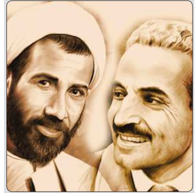
۸ شهریورماه سالروز شهادت مظلومانه شهیدان محمدعلی رجایی و محمد جواد باهنر به دست منافقان و روز مبارزه با تروریسم گرامی باد

۳- داوطلبان باید با در نظر داشتن شرایط خانوادگی و شخصی خود و محدودیت هایی