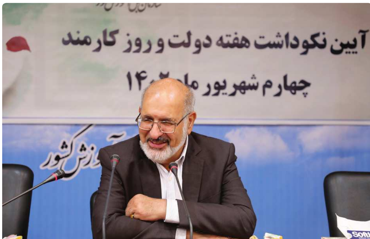
رئیس سازمان سنجش تأکید کرد