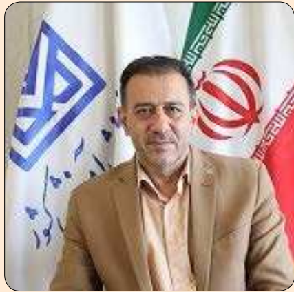
مشاور رئیس و مدیرکل روابط عمومی سازمان