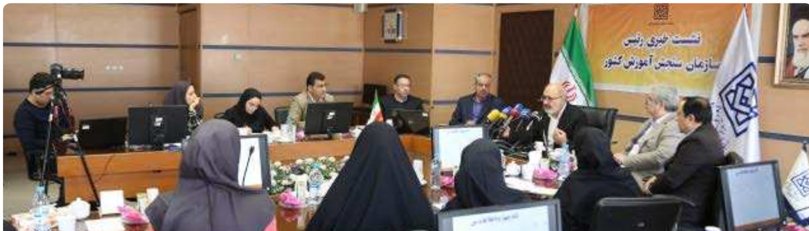
رئیس سازمان سنجش آموزش کشور تشریح کرد