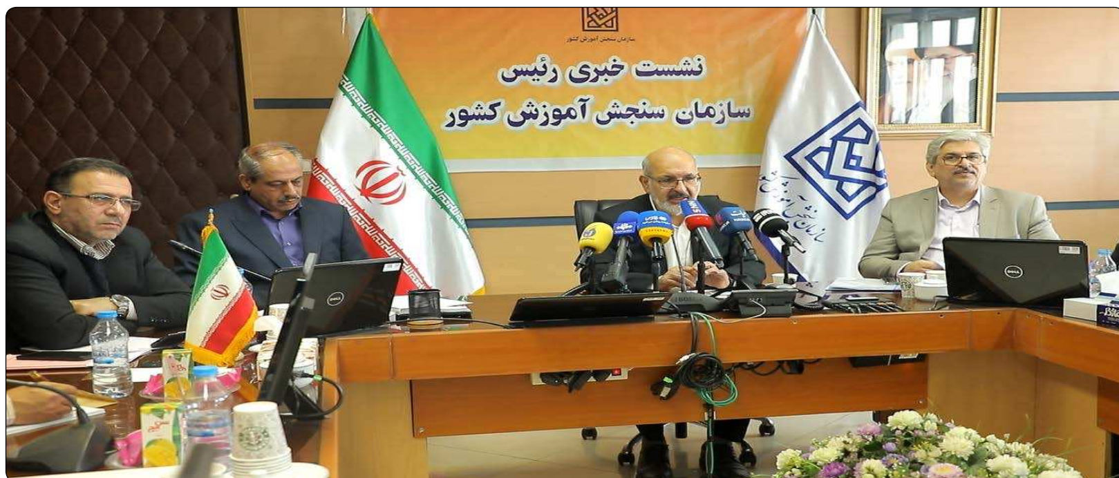
معاون آزمون های سازمان سنجش گفت: