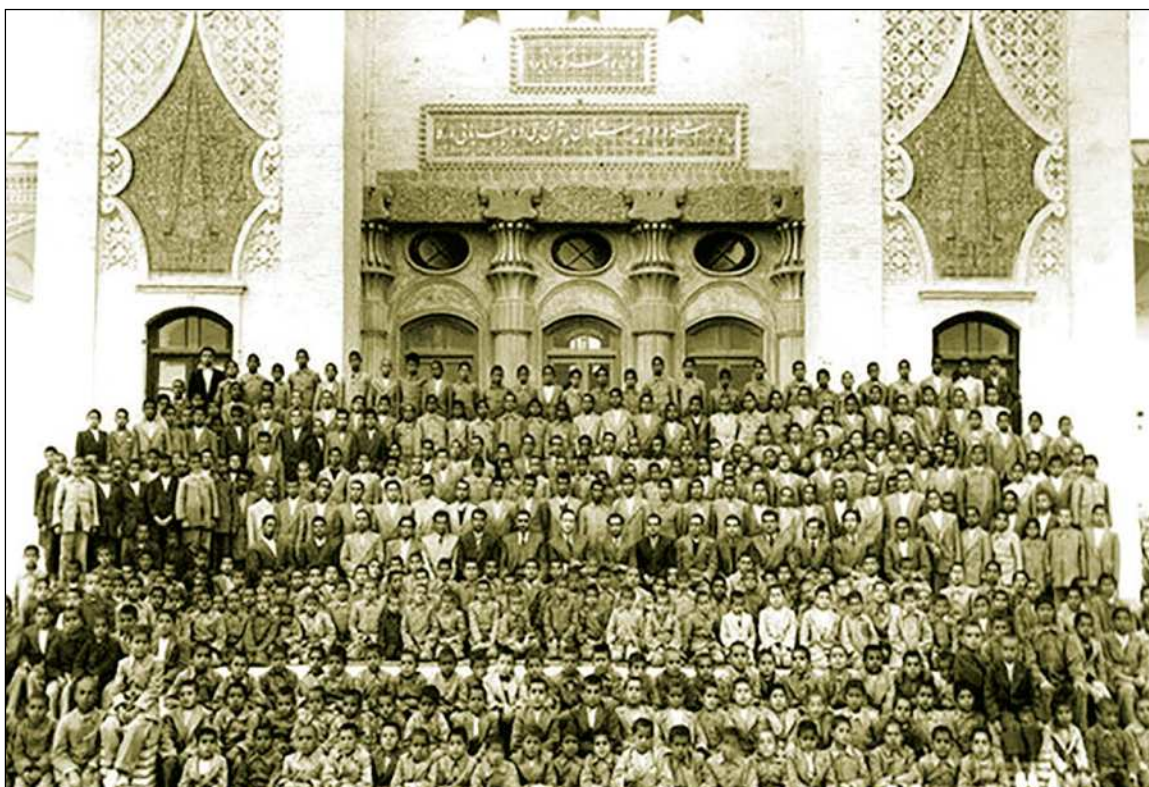
نخستین مرکز آموزشی نوین در ایران، دانشسرای عالی (دارالمعلمین قبلی و تربیت معلم بعدی و خوارزمی کنونی)

علاوه بر رتبه‌بندی دانشگاه‌ها در سطح جهانی، در داخل کشور نیز رتبه‌بندی علمی دانشگاه‌ها صورت می‌گیرد و متولی آن، سازمان آی اس سی (ISC) ۳ است که به رتبه‌بندی دانشگاه‌ها و مؤسسات پژوهشی ایران می‌پردازد. طبق ارزیابی انجام شده این مؤسسه، جایگاه دانشگاه‌های برتر کشور بین ۱۰۰ دانشگاه، در سطوح مختلف، در جدول زیر بیان شده است.